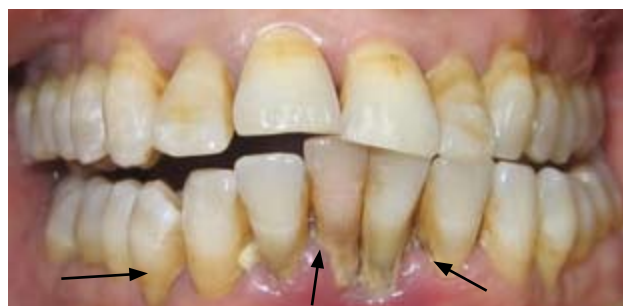
Daim duab kab mob hniav thiab pob txha yaig

Yog tias tus neeg muaj mob tem toob Alzheimer los yog lwm hom kev tem toob, tej zaum nws yuav qhia tsis tau rau koj hais tias nws hnov mob. Cov neeg tu xyuas looj hnab looj tes, yog tsim nyog looj ntsej muag ces looj yuav tsum ua tib zoo muab tus neeg mob lub qhov ncauj xyuas seb puas pom muaj kab mob dab tsi.