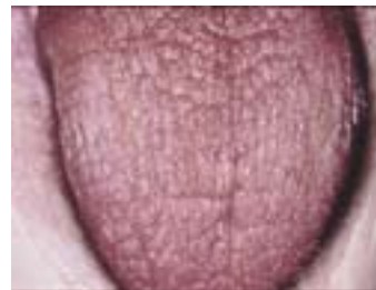
Tus nplaig uas qhov ncauj qhuav