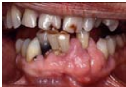
Nqaij Hlav Tshaj thiab hniav lwj

Yog tias tus neeg muaj mob tem toob Alzheimer los yog lwm hom kev tem toob, tej zaum nws yuav qhia tsis tau rau koj hais tias nws hnov mob. Cov neeg tu xyuas looj hnab looj tes, yog tsim nyog looj ntsej muag ces looj yuav tsum ua tib zoo muab tus neeg mob lub qhov ncauj xyuas seb puas pom muaj kab mob dab tsi.