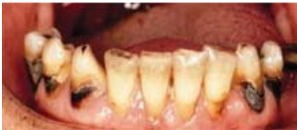
Cov kab noj hniav pom tshwm ntawm cov hauv paus hniav

Xaus no, mus ntsib koj tus kws kho hniav CDA kom cuag ncau kom tau cov tshuaj flouride thiab lwm cov kev tu koj cov hniav thiab lub qhov ncauj kom noj qab haus huv.