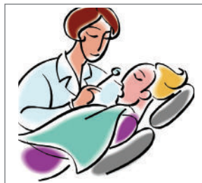
家人接受牙科治療