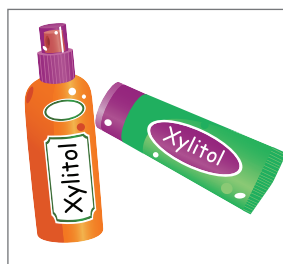
使用木糖醇噴霧、凝膠 或溶解片