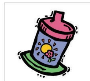
只用吸杯喝水或牛奶