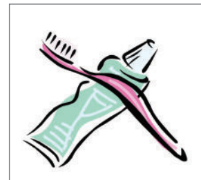
每天用含氟牙膏至少刷牙 2次牙