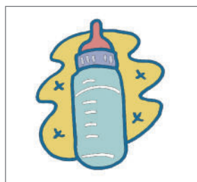
斷奶瓶 (睡覺時不用奶瓶)