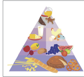
Đồ ăn nhẹ lành mạnh