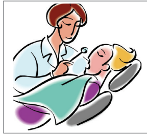
Gia đình nhận điều trị nha khoa