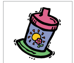
Chỉ để nước hoặc sữa trong bình mút