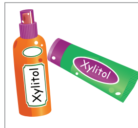
Sử dụng xylitol phun, gel hoặc thuốc hòa tan

Важно: Последнее, что касается зубов вашего ребенка перед сном, - это зубная щетка с фторсодержащей пастой.