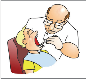
Khám răng định kỳ cho trẻ