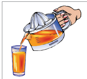
Ít hoặc không có nước trái cây