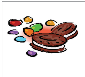
Ít hoặc không có đồ ăn vặt và bánh kẹo