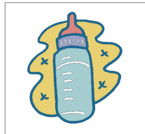
Bình bú sữa (không có bình để ngủ)