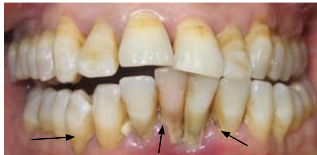
Daim duab kab mob hniav thiab pob txha yaig

Yog tias tus neeg muaj mob tem toob Alzheimer los yog lwm hom kev tem toob, tej zaum nws yuav qhia tsis tau rau koj hais tias nws hnov mob. Cov neeg tu xyuas looj hnab looj tes, yog tsim nyog looj ntsej muag ces looj yuav tsum ua tib zoo muab tus neeg mob lub qhov ncauj xyuas seb puas pom muaj kab mob dab tsi.