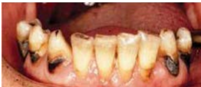
Кариозные полости на обнажённых корнях

И последнее: обязательно регулярно ходите на приём к стоматологу, состоящему в Ассоциации стоматологов Калифорнии, для того, чтобы врач мог провести лечение фтором для защиты зубов и обеспечить всё необходимое для того чтобы Ваши зубы и рот были здоровыми.