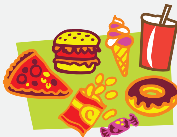
Сладости, еда, напитки, сахар